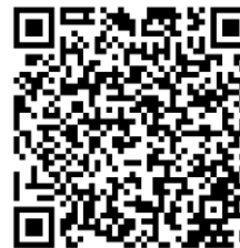
報名 QR CORD

4. 報名作業及退費作業手續冗長及繁雜，請各位家長審慎考慮並確認學生學習意願後再行報名。