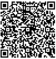
報名 QR CORD